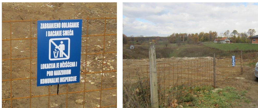
Slike 8 i 9: Primjer postavljanja natpisa o zabrani bacanja smeća u naselju Prošići

Nakon prijave nadležnim licima i provedenih radova čišćenja divljeg odlagališta otpada biće razrađen sistem izvještavanja o zatvaranju lokacije na koju su stanovnici ilegalno odlagali otpad. Najefikasniji način izvještavanja o zatvaranju divljeg odlagališta otpada je postavljanje natpisa o zabrani bacanja smeća, što će ubuduće biti zadatak JKP „Čistoća“ kod svakog saniranog odlagališta.