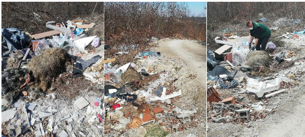
Slike 3, 4 i 5: Evidentiranje i postupak uklanjanja divljeg odlagališta otpada u naselju Donja Koprivna

Suština cjelokupnog postupanja s otpadom je kontrola proizvođača otpada i plansko upravljanje. Kontrolirano odlaganje određene kategorije otpada na propisno uređenom sanitarnom odlagalištu početni je oblik iskazivanja ekološke svijesti koja je uveliko uvjetovana i mogućnostima rukovođenja plaćanja usluge, jer su takvi sistemi obrade i odlaganja propisani graničnim vrijednostima utjecaja na okoliš.