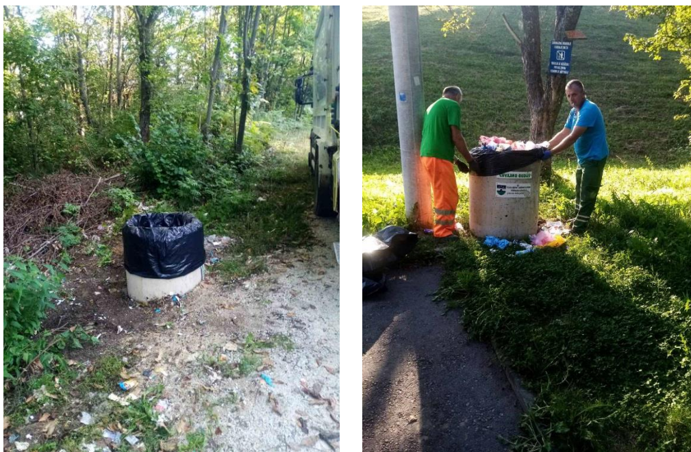
Slike 8 i 9: Postavljanje betonskih kanti na putnom pravcu Gnjilavac – Gornja Koprivna

Video nadzor i upozorenje na postojanje video nadzora imaju funkciju odvraćanja, detekcije, te identifikacije i rekonstrukcije događaja na prostorima koji su pokriveni slikom video kamere, a koji su ranije bili mjesta ilegalnog odlaganja otpada. JKP „Čistoća“ će u narednom periodu biti obavezna označiti svako sanirano odlagalište otpada prikladnom oznakom, a u skladu s raspoloživim sredstvima, postaviti video nadzor i upozorenja na postojanje video nadzora na mjestima najčešćeg nastajanja divljih odlagališta.