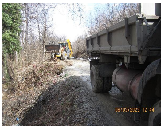
Slike 6 i 7: Postupak sanacije divljeg odlagališta otpada u mjesnoj zajednici Skokovi

Revitalizacija saniranih površina će se raditi planski radi što boljeg uklapanja u okolinu u kojoj je divlje odlagalište primjećeno i sanirano. Rekultiviranje završnih površina, nakon uklanjanja otpada i čišćenja površine, će se provoditi sadnjom trave, bilja ili sadnjom drveća koje je karakteristično za okolinu saniranog odlagališta. Daljnja namjena prostora će se utvrditi u skladu s mjestom s kojeg je uklonjen otpad.