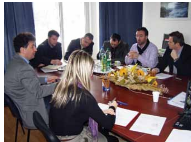
Na prezentaciji u UNA CONSULTINGU

Za pokretanje partnerskog projekta nekonvencionalnim tehnologijama u ovoj oblasti, potrebno je u pripremnom periodu sačiniti Procjenu postojećeg stanja. Prema odluci SDC-a i Vlade Republike Slovenije procjenu će provoditi „UNA Consulting“ zajedno sa slovenskim partnerima, a na osnovu ove procjene predstavnici švicarske i slovenske vlade će donijeti odluku o daljem financiranju projekta.