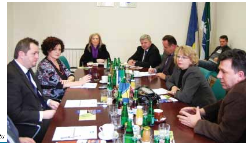
Sastanak u kabinetu