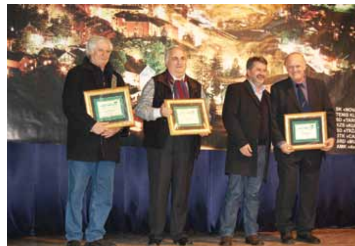
Zlatne plakete za doprinos razvoju sporta

sportovima, a u ostalim sportovima najbolja je muška ekipa AMK „Extra Sport“. U muškoj konkurenciji loptačkih sportova pobjedu je ove godine odnijela ekipa NK „Krajina“. Važno je napomenuti da je ove godine proglašeno i 18 sportskih nada, kojima je ovom prilikom uručeno i priznanje.