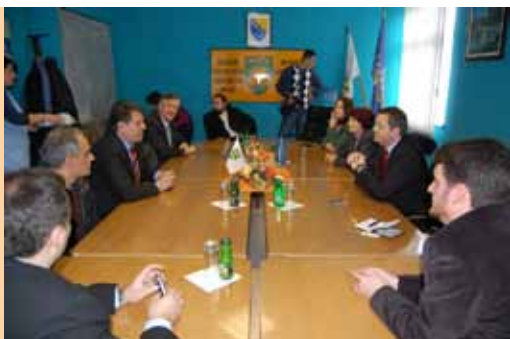
Prijem u Goraždu

Općina Cazin i njeni građani još jednom su pokazali svoju veliku humanost. Naime, akcija „Cazin za Goražde“, koju su zajednički realizirali Općina Cazin, Udruženje „Srce Cazina“, Crveni križ i MIZ Cazin, rezultirala je vrijednom donacijom napaćenim Goraždanima.