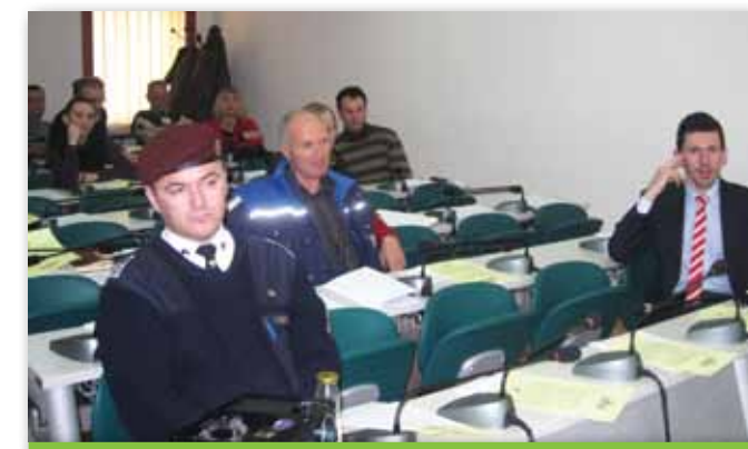
Radionica u vijećnici

Tim povodom je krajem februara u Vijećnici općine Cazin održana radionica za članove Savjeta MZ. Ovim predavanjem se nastoji pomoći Savjetima MZ da usvoje znanja i vještine iz oblasti projektnog menadžmenta, upravljanja ljudskim resursima, prikupljanja sredstava i strateškog planiranja. Ideja je da Savjeti MZ usvoje prakse i procedure kojima će osigurati zastupljenost predstavnika različitih kategorija stanovništva, posebno mladih i žena, u njihovom radu i planiranju lokalnog razvoja.