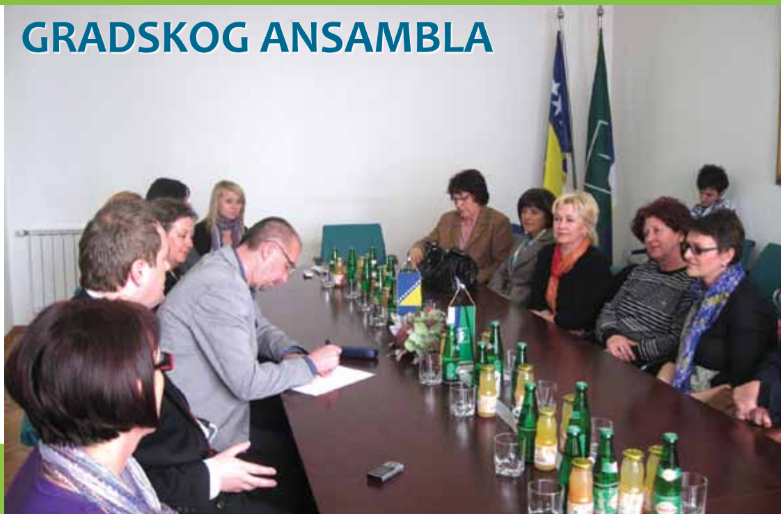
Gradski ansambl LIRA