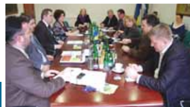
Načelnik i cazinski zastupnici

Zastupnicima je ovo bio drugi radni sastanak kod načelnika općine čime pokazuju dobru volju i iskrene namjere da se uključe u procese rješavanja problema koji se tiču svih građana na području općine Cazin.