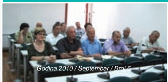
Godina 2010 / Septembar / Broj 6

Prema riječima profesora Salkića, općina bi trebala preuzeti na sebe obavezu interent priključka za sve škole, što će u narednom periodu i biti realizirano.