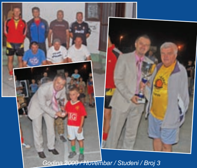
Godina 2009 / Novembar / Studeni / Broj 3

Skoro dvije stotine takmičara učestvovalo je na ovogodišnjim sportskim igrama u nekoliko disciplina, koje je, pored takmičarskog duha, okupljalo i druženje. Treće po redu, Cazinske sportske igre odvijale su se kao dio programa manifestacije obilježavanja Dana općine. Najuspješnije ekipe u malonogometnom turniru bile su ekipe MZ Gnjilvac, u kategoriji veteran, i FK Krajina, među pionirima, dok je na rukometnom turniru najuspješnija bila ekipa veterana RK Krajina, koja je također pobjednik i u povlačenju konopca. Pobjedničke pehare i diplome uručio je općinski načelnik Nermin Ogrješević, koji je uz ekipne pobjedničke pehare uručio i pehare za najstarijeg i najmlađeg učesnika, najboljeg igrača i strijelca u svim kategorijama.