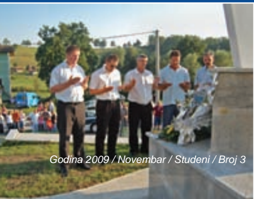
Godina 2009 / Novembar / Studeni / Broj 3

Te večeri je održan i noćni revijalni turnir u malom nogometu na igralištu OŠ Šturlić, kao sastavni dio programa obilježavanja ove svečanosti.