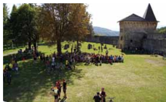
Druženje na Ostrošču

sa područja cijelog USK-a okupili su se na platou ispred zgrade Stare gimnazije. Završna tačka biciklijade bio je Stari grad Ostrožac, gdje su domaćini bili mladi Udruženja Stari grad Ostrožac. Za sve učesnike i prisutne pripremljen je paprikaš. Biciklijadi se pridružio i općinski načelnik Nermin Ogršević, i kao rekreativni biciklista, naglasio nespornu podršku ovakvim i sličnim aktivnostima, koji idu u pravcu promocije biciklizma i zaštite okoliša. Prema riječima predsjednika BKC Samira Japića cilj akcije je promocija zdravog načina života, ukazivanje na potrebu očuvanja okoliša i svakako druženje u svrhu jačanja duha zajedništva u našoj lokalnoj zajednici.