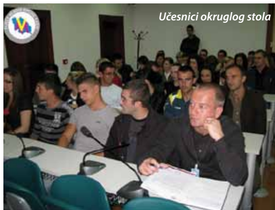
Učesnici okruglog stola

U okviru ovog projekta Općina Cazin i Vijeće mladih su već realizirali niz značajnih aktivnosti i programskih zadataka. Prvobitno je održan okrugli sto