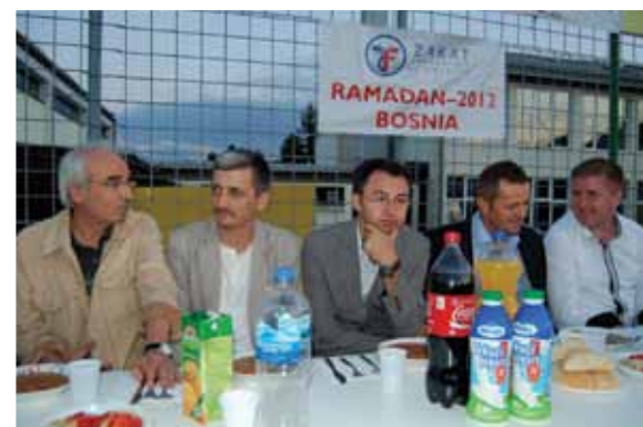
Načelnik sa donatorima

Iftaru je prisustvovalo preko 700 postača, kojima se na kraju kratko obratio i muftija bihački Hasan ef. Makić.