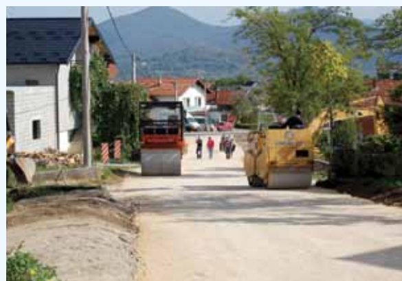
Put u izgradnji

Dana 24.09.2012. godine načelnik općine Cazin posjetio je MZ Ostrožac, tačnije Đuzelić brdo, gdje je izvršena rekonstrukcija potpornog zida mezarluka „Šehiti“, koji se nalazio pred urušavanjem i time ugrožavao sigurnost samih prolaznika. U rekonstrukciju istog je uloženo oko 10.000,00 KM, a radove je izvodila lokalna firma. Nakon toga, načelnik je u pratnji svojih saradnika posjetio put u izgradnji zvani „At-Mejdan“, također u MZ Ostrožac. Radi se o projektu u koji će biti investirano preko 35.000,00 KM.