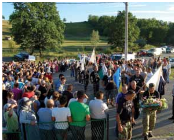
Doček učesnika marša

Na kraju program nekoliko koreografija KUD Šturlić razveselilo je sve prisutne.