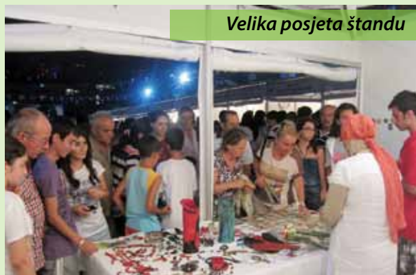
Velika posjeta štandu