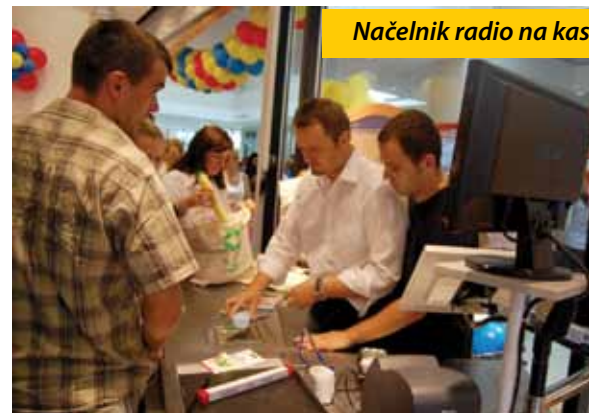
Načelnik radio na kasi