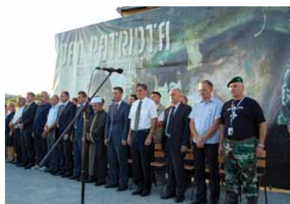
Svečani dio programa