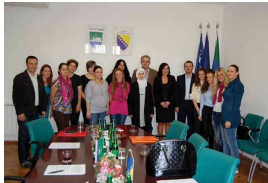
Načelnik sa odgajateljicama