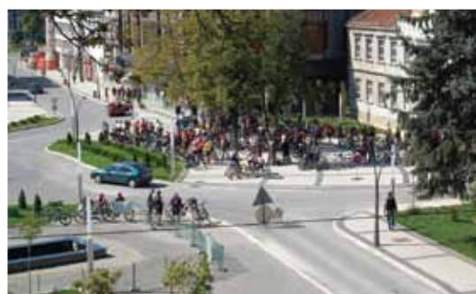
Okupljanje ispred stare Gimnazije